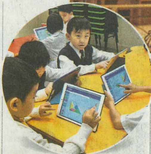
透過電子學習，培養同學的自主獨立學習精神。

不只高年級的同學才有機會服務他人，即使是一年級的同學，也一樣會分派任務，如IT小老師、班長、行長等職務。來到四年級，服務對象則會由全班擴展至全校。「除有公益少年團、男女童軍、紅十字會；亦有校內擔任不同工作的大使。」