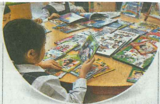
▲學校圖書館佔地頗大，而且藏書豐富，同學享有極佳的閱讀環境。（受訪者圖片）