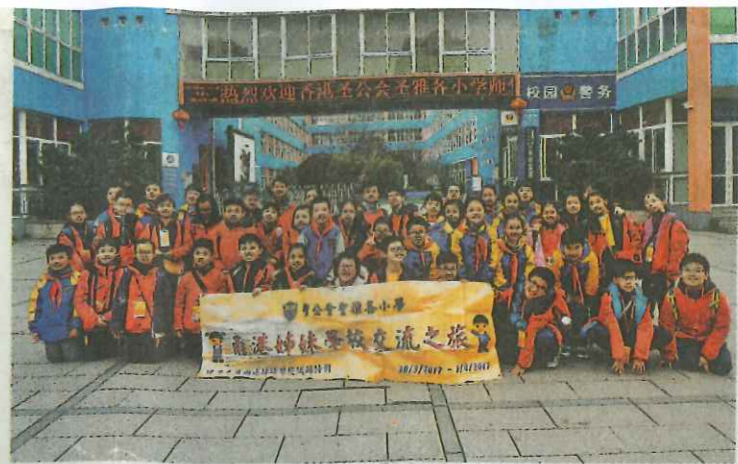
▲同學與內地姊妹學校鄞州區第二實驗小學進行交流活動。

面試方面，由老師以個別形式和考生進行，每個老師約單獨接見20位考生。張校長稱，由同學踏入學校開始，其實老師已經開始觀察。「在排隊、Playroom玩遊戲、看書的時間裏，考生的言行舉止都是老師會留意的。」在老師單獨會見的環節，則以兩文三語發問問題。「只是一些簡單的語文、常識及數學問題。例如給他們看一張獅子的圖片，同學如可以英文、普通話說出獅子，又懂得回答其顏色的話，就很不錯。」