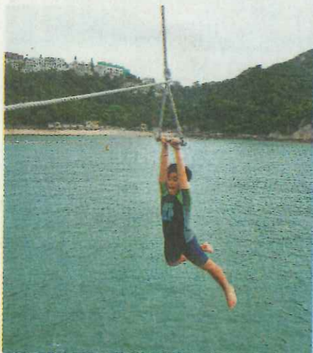
▲為增加學生自信，學校特別舉辦「乘風航」海上歷奇活動。

品格與學業作為基礎教育是十分重要，而在這兩方面外，學校亦沒有忽略同學的身體健康。學校悉心打造健康校