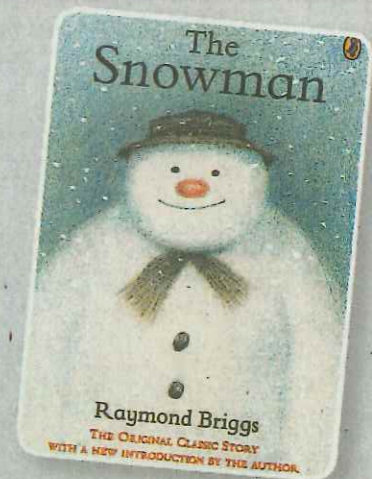
▲除了The Snowman外，Raymond Briggs還有兩本著名作品Father Christmas和The Bear。