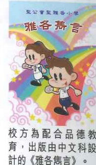
校方為配合品德教育，出版由中文科設計的《雅各雋言》。

學校的「雅各孩子」，以關愛、尊重、誠實、寬恕、承擔、感恩和分享7個品格特質為成長目標，經過6年的生命教育，讓他們明白品德的重要。每年學校都會以一個主題為學習目標，如今年是「誠實」，學校會計劃及推動配合這個主題的活動。《雅各雋言》中的名言、諺語也是根據這7個特質而編制，張校長表示品德學習是一種知識的累積，對孩子的成長有莫大幫助。