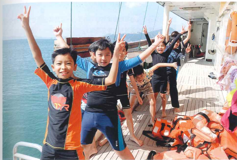
學生在「乘風航」活動中乘風破浪，克服困難，提升自信。