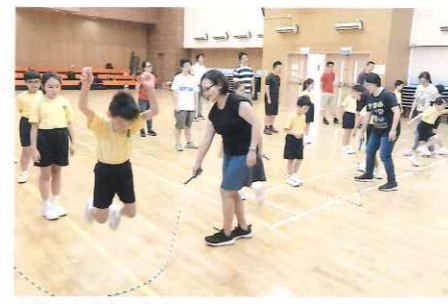
學校參與「賽馬會家童喜動計劃」，鼓勵親子同運動。

在午膳上，學校十分重視午膳供應商能否提供合乎營養價值的午膳餐單，並由老師及家長義工組成的午膳監察小組定期檢視午膳的營養質量。