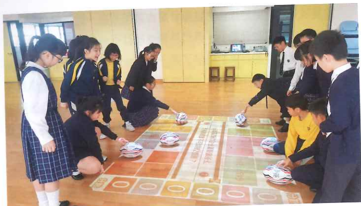
學生利用「互動地板」進行學習活動。