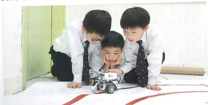
LEGO機械人訓練學生的思維能力和探究精神。

學校的許多學生都會外出參與不同的比賽，而張校長表示這些比賽是視乎學生的能力及需要而安排，亦會鼓勵他們自由參與。校方主