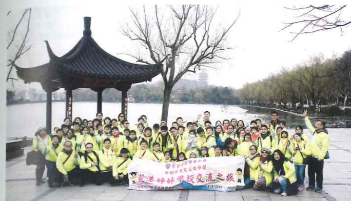
學校舉辦境外交流活動，擴闊學生視野。